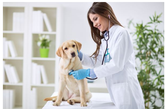
Exames podem detectar com precisão problemas cardíacos nos pets ( DINO )

São Paulo, SP, 25/09/2019 – setembro, celebra-se o Dia Mundial do Coração, data que chama atenção para a principal causa de morte no mundo: as doenças cardiovasculares. Segundo a Organização Pan-Americana da Saúde (OPAS), estima-se que, somente em 2015, mais de 17 milhões de pessoas morreram por essas enfermidades. Entre os animais, também são comuns as doenças relacionadas a esse órgão vital, em especial nos pets idosos.